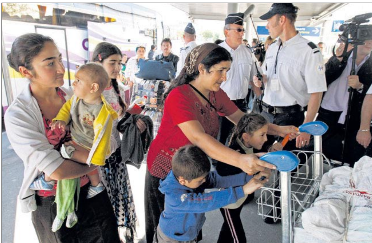
Jedni z prvních dobrovolně repatriovaných Romů.