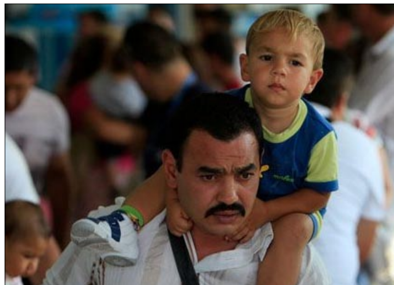
Rómský otec se svým synem při návratu z Francie do Bukurešti.

Ministr zahraničí Karel Schwarzenberg v souvislosti s vyhošťováním rumunských Romů z Francie nařkl prezidenta Nicolase Sarkozyho z rasistických pohnutek. „To, jak prezident Sarkozy vyhošťuje rumunské občany, je proti duchu a stanovám EU.“ (red)