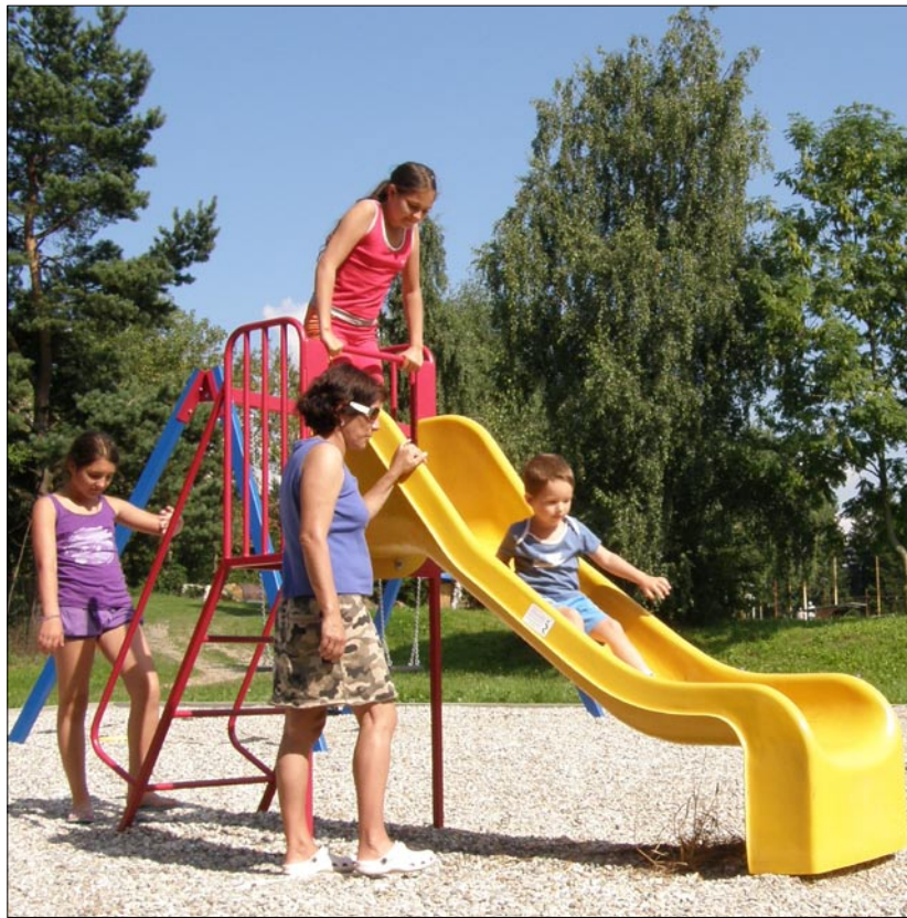
Malé i větší děti z Rýmařova si užívaly pěkného letního počasí na klouzačce a při vodních hrátkách.