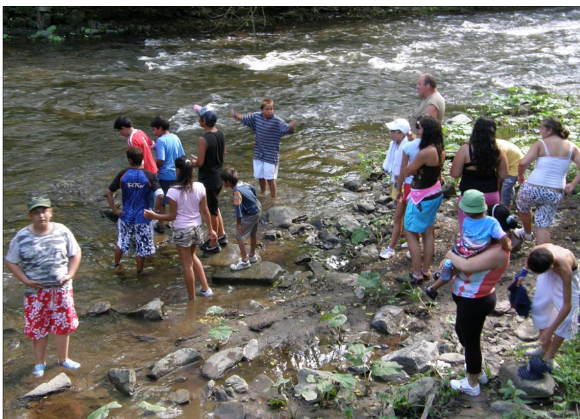
Děti z Hodonína a z Jesenicka brodily pod dozorem vedoucích blízko řeku Svratku.