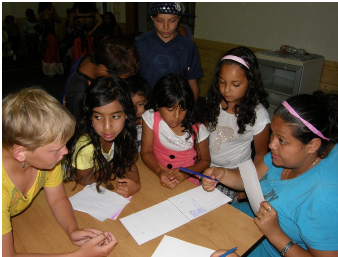
Děvčata z Jesenicka při zápisu do taneční soutěže.