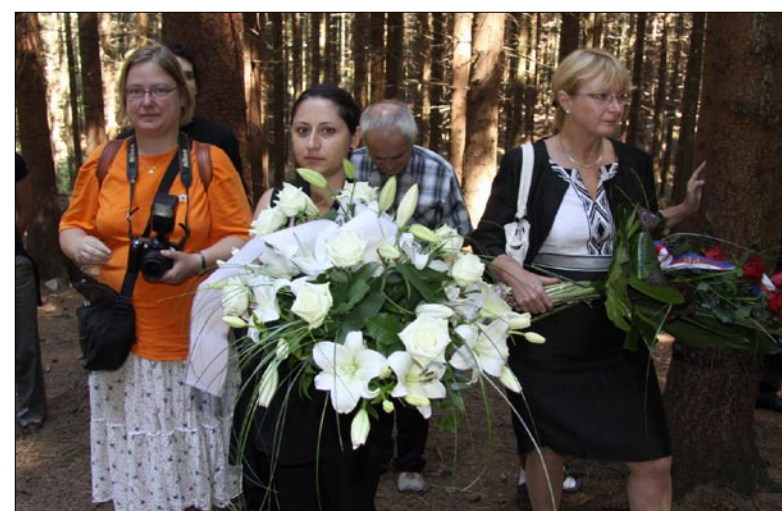
U pomníku v místě hromadných hrobů zemřelých.