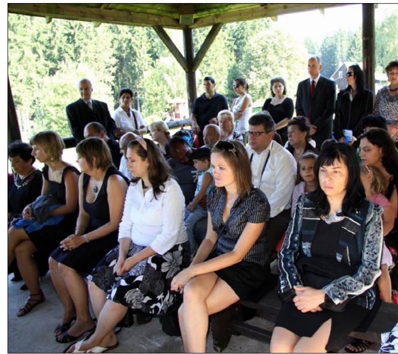
Naslouchající účastníci na verandě jednoho z původních „baráků“.

Vám zde přítomným se omlouvám, pokud se vás moje slova dotkla, ale už uplynulo dost času, aby mohlo být toto slovo vyřčeno, aniž by bylo podezříváno z nepřiměřenosti. Karel Holomek