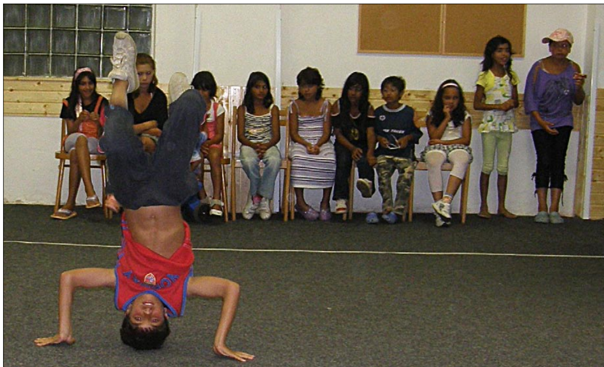
Při deštivém počasí se děti věnovaly taneční soutěži a různým hrám ve společenské místnosti.