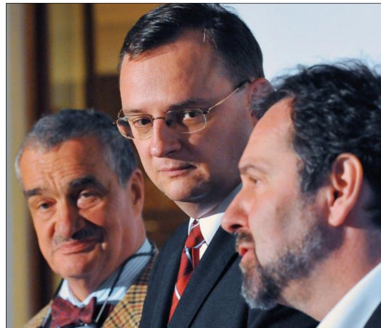
Vládní lídři Karel Schwarzenberg, Petr Nečas a Radek John.