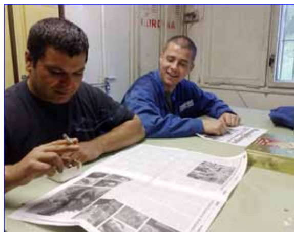
Naši čtenáři tam v Karviné...