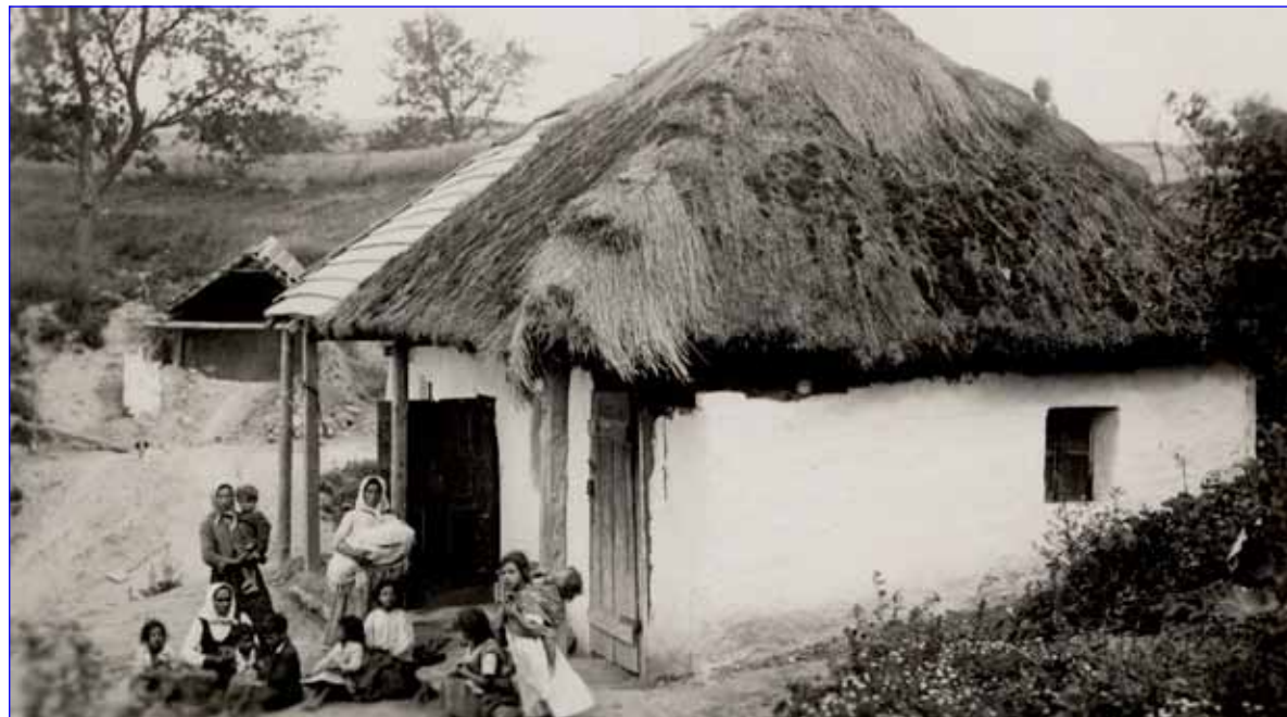
Romská osada, Lomnice (Slovensko), 1931.