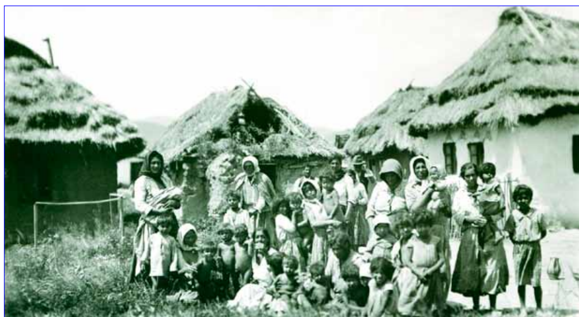
Romská osada, Podkarpatská Rus, 1929.