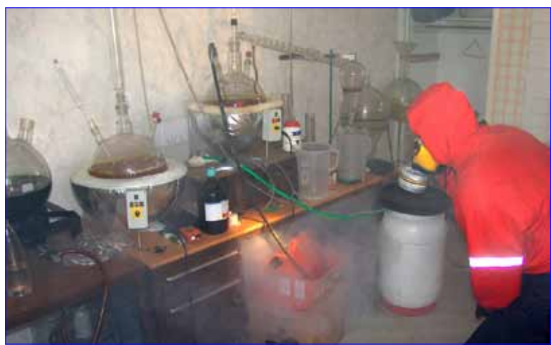
výroba tvrdých drog