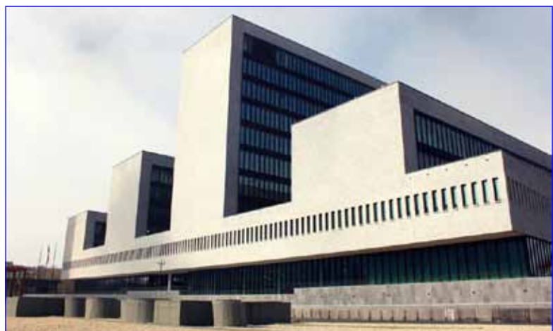
budova Europolu v Haagu