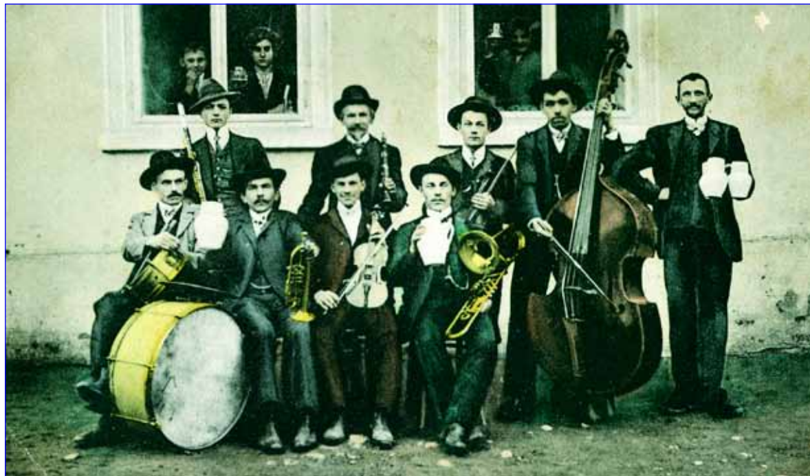
Romská kapela, lokalita neznámá, 20. léta 20. století.