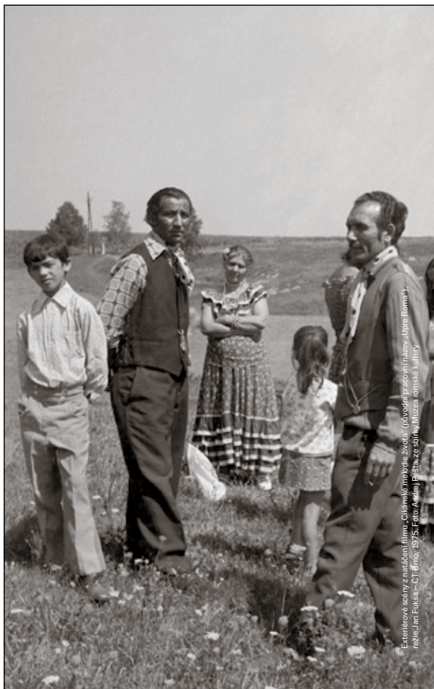
Exhibiční fotografie a naučební film: Cikánský zpěvák, sbírka: (1935) a (1975) z období II. světové války.