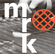
Foto: Ombalista Jan Gašpar Hrásko, 70. léta 20. stol.