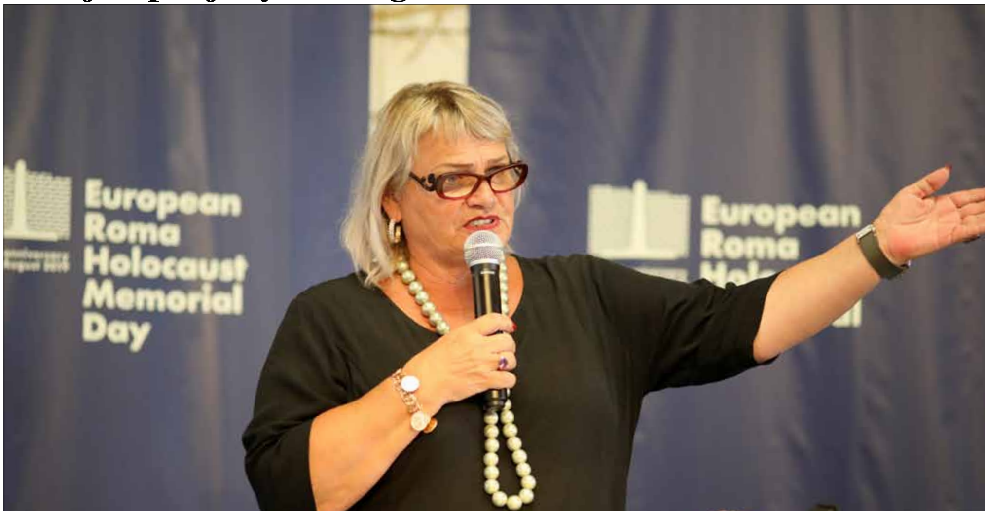
Bývalá členka Evropského parlamentu Soraya Post – lidskoprávní bojovnice proti anticiganismu