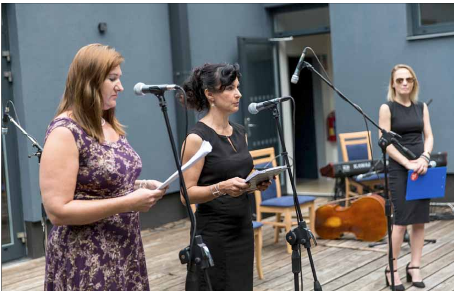
Otevření Památníku Holokaustu Romů a Sintů na Moravě v Hodoníně u Kunštátu

Při té příležitosti muzeum otevřelo památník veřejnosti. Podle Horváthové bude přístupný vždy od středy do neděle od 10:00 do 18:00 v období od dubna do října. Památník nyní nabízí v baráku vězňů a dozorců tři výstavy. Jedna je o genocidě, druhá přibližuje studentské práce na téma holokaustu a třetí ukazuje archeologické nálezy z Letů na Písecku, kde stával za války koncentrační tábor.