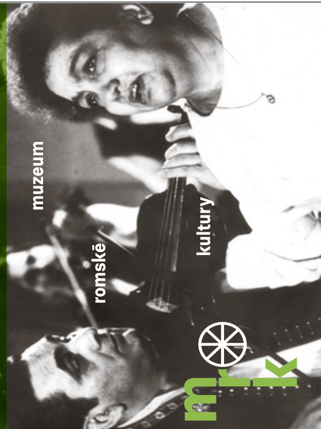
Foto: Emília Machalová a Eugen Horváth, 60.–70. léta 20. stol., autor neznámý ze sbírky Muzea romské kultury