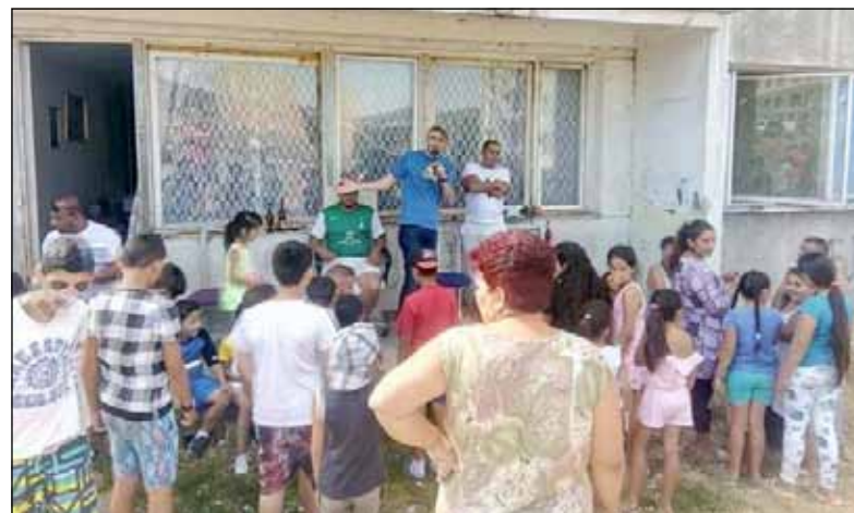
Komunitní den na chanovském sídlišti

Kroky města Mostu v oblasti bydlení lze ostatně považovat přinejmenším za hodné zvýšené kontroly. Je pozitivní, že si mostečtí odhlasovali zahájení odprodeje bytů po vzoru Chomutova a dalších měst, aby mělo město větší vliv na bydlení svých občanů než dosud. Diskutabilní ovšem je, že do toho