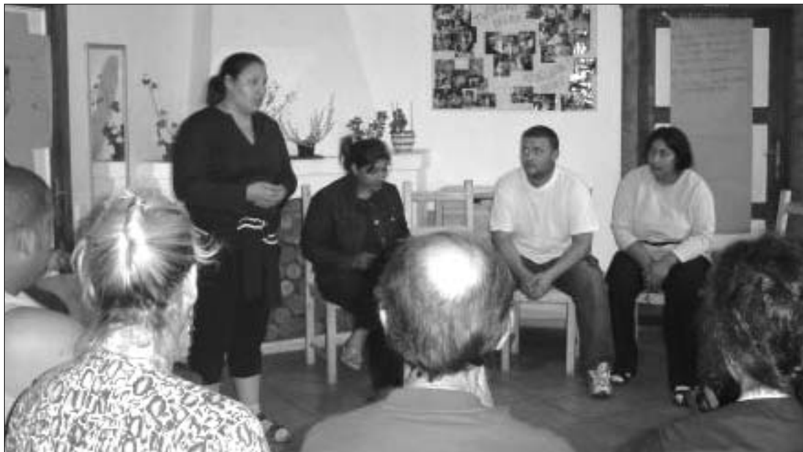
Členové domovního výboru panelového domu v Dobré Vodě