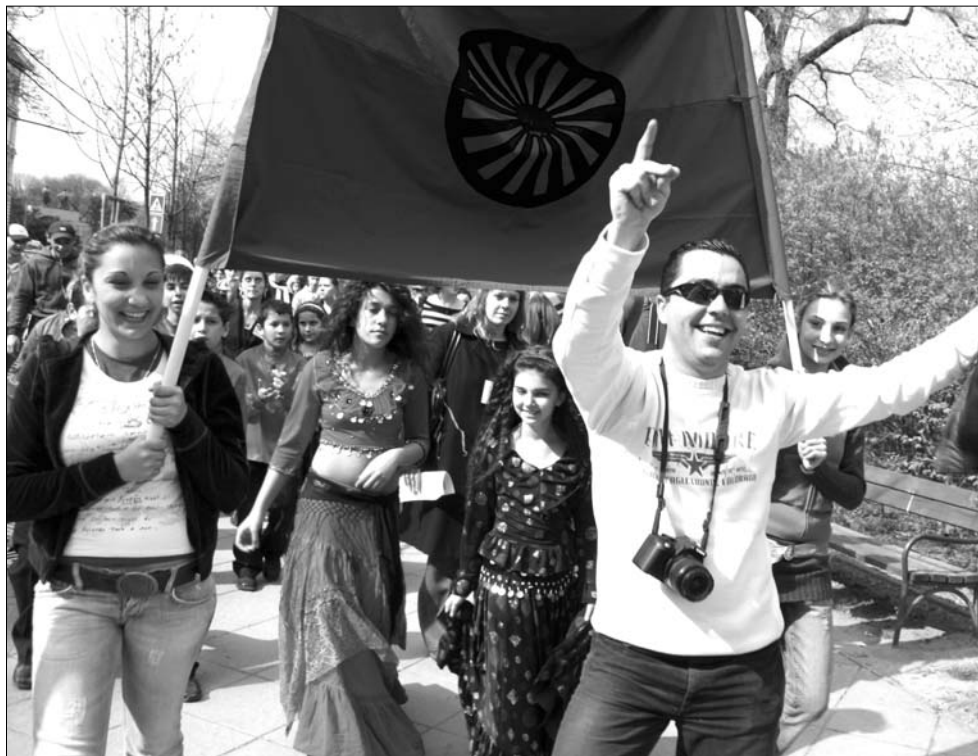
Zpěv a tanec provázely celou cestu brněnského průvodu. Park na Moravském náměstí pak přidal tu správnou jarní atmosféru

Na severu Moravy se organizace ujala sdružení Vzájemné soužití, Společně Jekhetane, Církevní základní škola Přemysla Pittra a klub Templ na Stodolní ulici, kde se konal slavnostní večer. Program 10. dubna zahrnoval vystoupení tanečních, pěveckých i recitačních souborů.