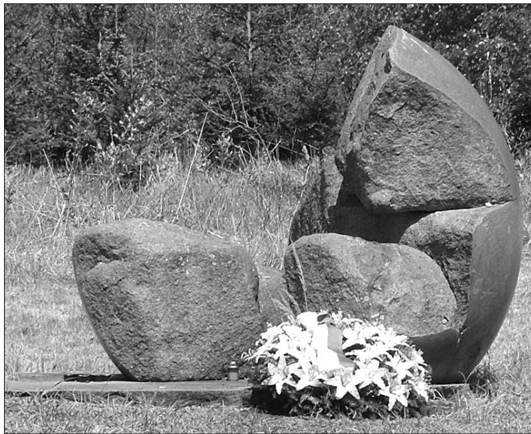
Památník v Letech u Písku