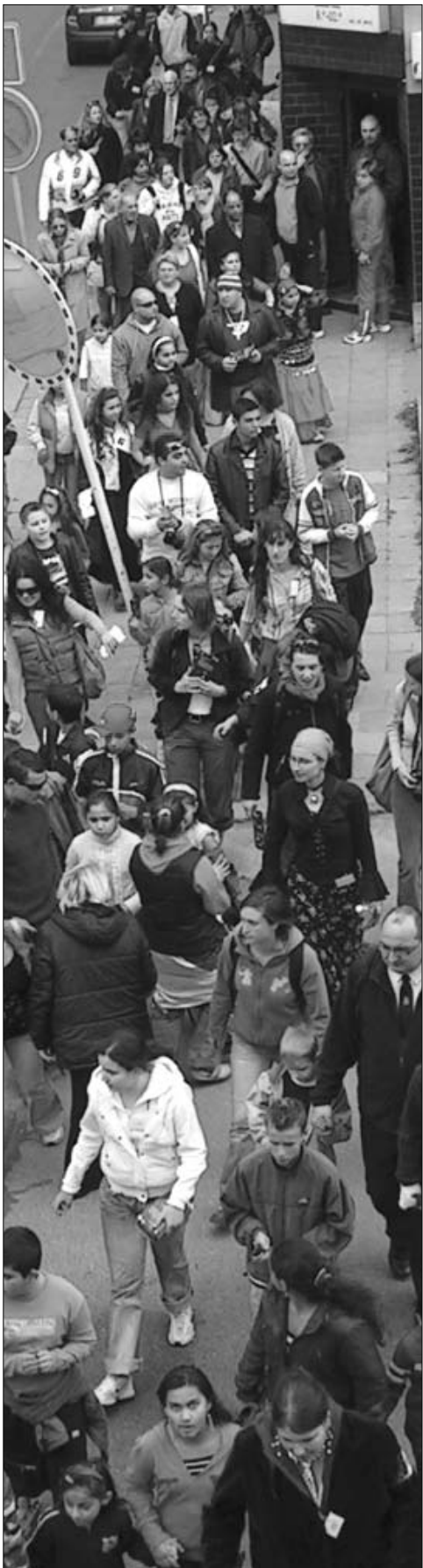
Z okna redakce Romano hangos se průvod zdál ještě výraznější než při pohledu z chodníku. Dlouhý had Romů zabral na délku více než sto metrů

Tentokrát byly oslavy zahájeny v Praze v pondělí 2. dubna prezentací na Palackého náměstí, kde si mohli kolemjdoucí poslechnout romskou hudbu, a zároveň se dozvěděli o původu Romů a jejich životě v ČR z infor-