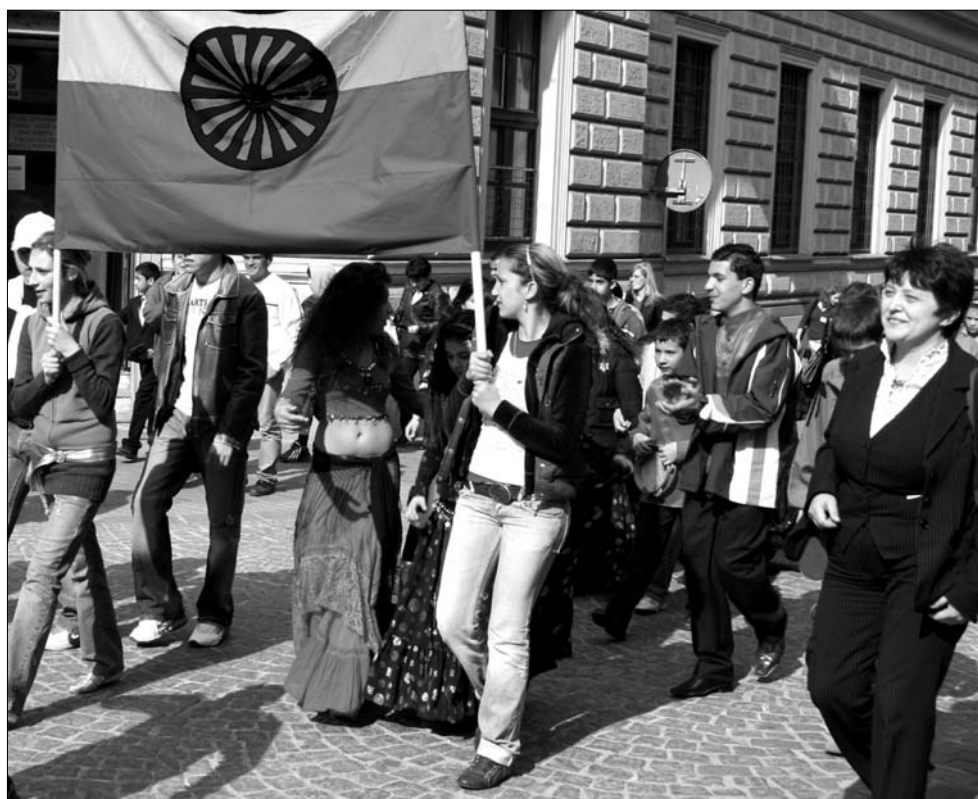
Ministryně Džamila Stehlíková (zcela vpravo) se cítila výtečně v přátelské atmosféře veselého průvodu, který mířil k náměstí Svobody v Brně

U Stromu tolerance pak zazněla slova o lepším vzájemném soužití Romů s majoritou, byl připomenut holocaust a varování (hlavně pro mladou generaci) před jeho opakováním. A zazněla také chvála příjemného počasí, které ministryně Stehlíková nazvala „brněnským jarem přinášejícím naději a čerstvý vítr“. Účastníci oslav poté vážali stužky v barvách romské vlajky kolem Stromu tolerance a seřadili se do průvodu, jehož čelo tvořili studenti Romské střední sociálně-právní školy s romskou vlajkou a děti v tradičních červenočerných krojích. Průvod se vydal z brněnské části Zábřovic ulicemi Francouzskou, Přádláckou a Bratř-