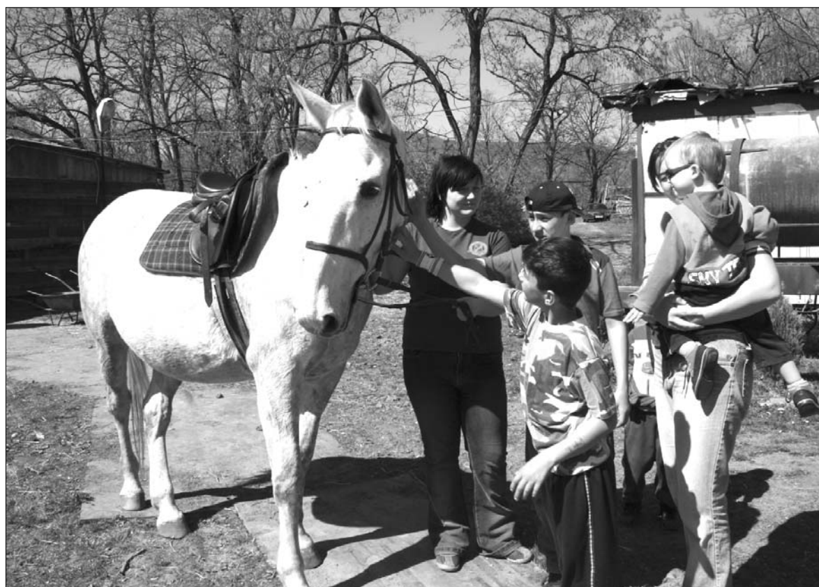
Na koňské farmě v Jeníkově se dětem líbilo