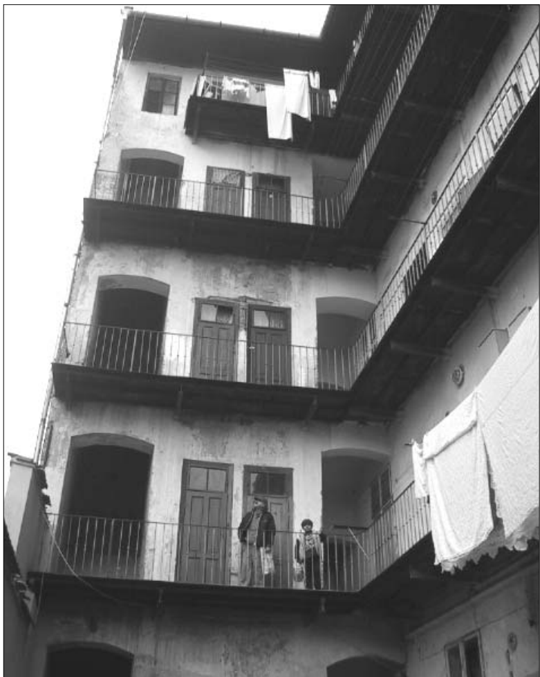
Ilustrační foto: Typický pavlačový dům na Bratislavské ulici v Brně

Za měsíc duben přednesla radnice městská část Brno-sever několik různých návrhů na řešení romské problematiky. Do působiště radnice spadá několik ulic obývaných převážně Romy, které vytváří ojedinělý jev: několikatisícové ghetto v centru města.