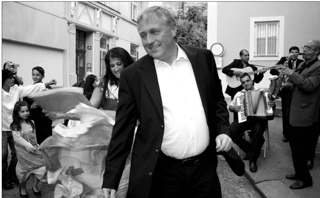
Premiér Topolánek tančí mezi Romy. Idylka, která se však příliš neslučuje s asociální politikou jeho vlády, ta chce bohatým dávat a chudým ještě více brát

Po sedmé večer začala úvodní část programu před schody divadla. Vedle stylového kouřícího kotlíku sedí kapela Jana Pokračování na str. 3