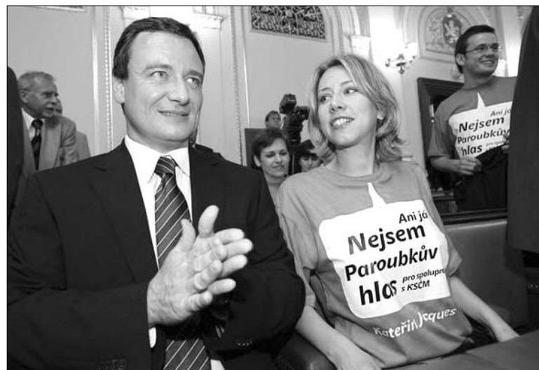
Jaká trička se budou ve sněmovně rozdávat příště?

Předsdkyně klubu zelených si reakce v diskuzi na závěr vložila jako „machismus a sexismus, který je v kuloárech sněmovny běžný a který byl přenesen na plénum“. Místopředseda sněmovny Zaořálek ovšem upozorňoval v první fázi předsdkyni klubu zelených marně na procedury jednacího řádu, ve sněmovně respektované všemi. I nováčky. Jsem přesvědčena o tom, že kromě machismu a sexismu vybulbalo na povrch i něco jiného. „Strana otevřená ženám“, mám-li citovat oficiální titul Strany zelených, udělený tak jako kdysi Rád Vítězného února.