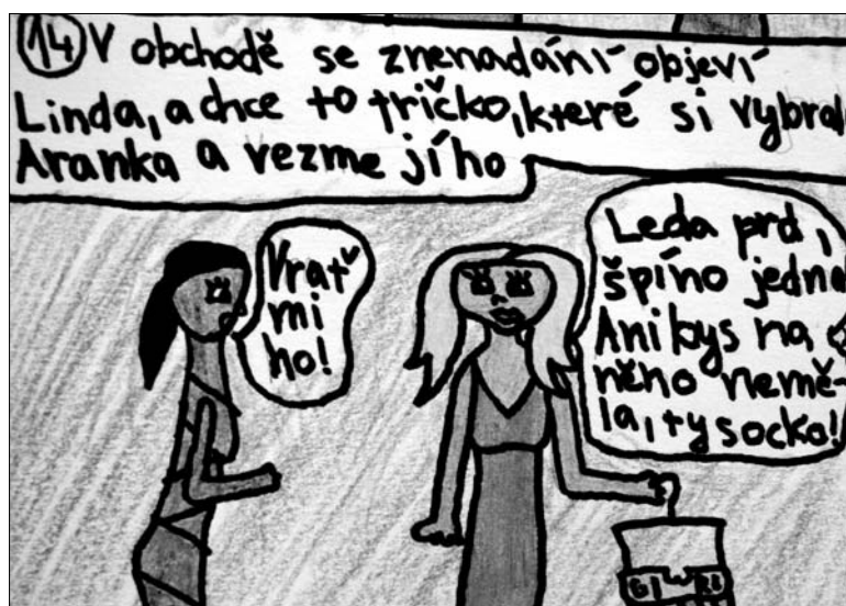
Komiks líčí strasti mladé Romky Aranky, která vede boj za své uznání a nakonec zvítězí díky svému laskavému srdci

Občanské sdružení IQ Roma servis (IQRS), které poskytuje sociální, poradenské a vzdělávací služby pro sociálně vyloučenou romskou komunitu, upozorňuje svým celoročním projektem na Evropský rok rovných příležitostí.