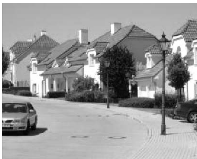
Malá Šárka, sídliště 145 luxusních vil v Praze-Nebošicích

Nyní se věnujme skupině „Romové“ a dle takového hlediska vybraným lokalitám. V případové studii Chanov autoři (Jana Temelová, Jakub Novák) dospěli k následujícímu: „Romské rodiny v Chanově jsou příbuzensky propojeny. Fungují jako rodinné klany, mezi kterými ale nevznikají významnější konflikty. V lokalitě existuje hierarchické uspořádání rodin; movitější romské rodiny – většinou získaly peníze nepoctivě – zneužívají naivnější a chudší rodiny. Například „Romšéf“ nechá za odměnu 500 Kč podepsat smlouvu na mobilní telefon někomu jinému. Ten je šťastný, že dostal 500 Kč, ovšem za dva měsíce po něm operátor vymáhá desetitisíce. Řada Romů je velmi naivních a lehce se dá napálit. Děti z bohatších rodin jsou arogantní a dělají ve škole největší problémy. V rodinných domcích ve starém Chanově bydlí lichváři (přestěhovali se sem ze sídliště). Romové si od nich půjčují, i když vědí, že půjčka je se stoprocentním úrokem, dokonce sami lichváře vyhledávají. Úroveň a způsob života Romů se liší rodina od rodiny. Některé rodiny demolují byty a vyhazují odpadky z okna, jiné domácnosti jsou čisté a uklizené. V posledních dvou desetiletích došlo ke zhoršení vztahů uvnitř komunity.