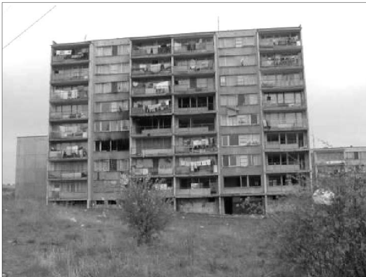
Vybydlené paneláky v Chanově