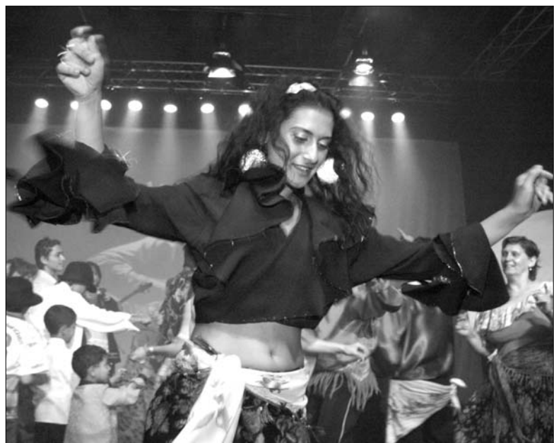
Krásná tanečnice slovenského divadla Romathan