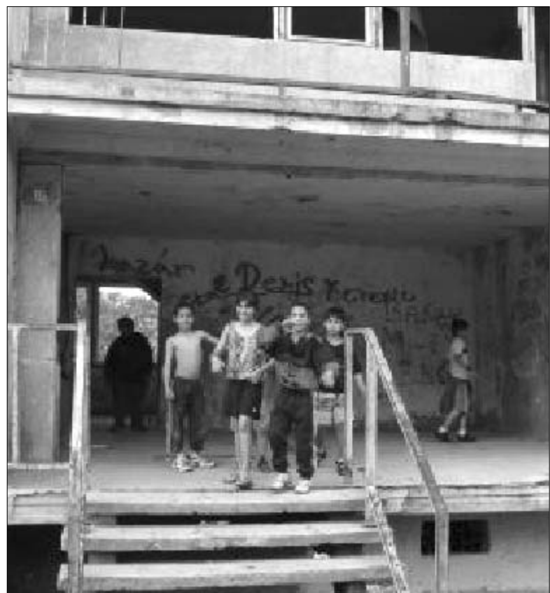
Chanovské děti ve vchodu do panelového domu

1) Univerzita Karlova v Praze, Přírodovědecká fakulta, Katedra sociální geografie a regionálního rozvoje, Centrum pro výzkum regionů, Závěrečná zpráva projektu WA-014-05-Z01, leden 2007