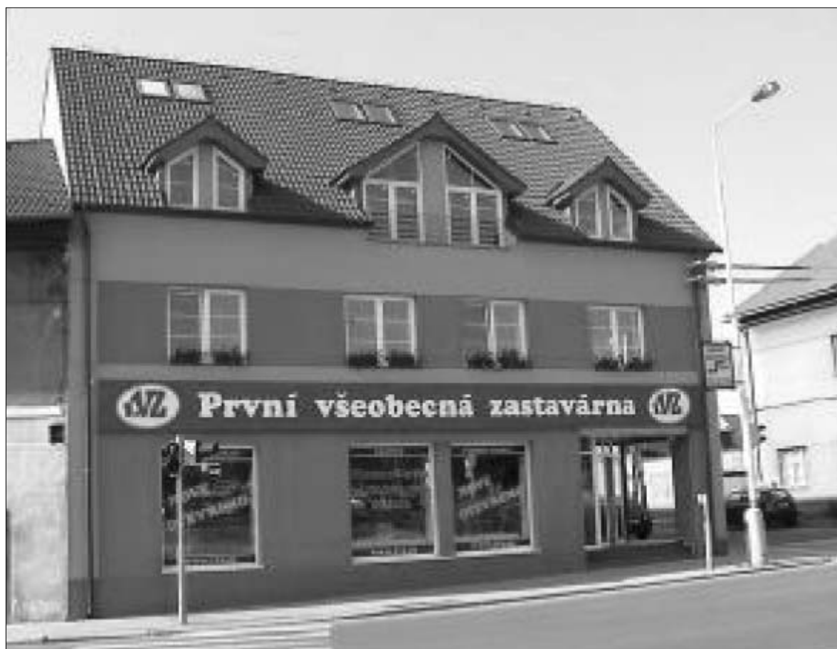
Části lokality v Kladně-Starých Kročehlavech mají dlouhodobě rozkopány ulice, v severní části je pouze pražná cesta, dům ve vlastnictví města na atraktivním místě Kročehlavské ulice je pronajímán soukromé firmě provozující zastavárnu!