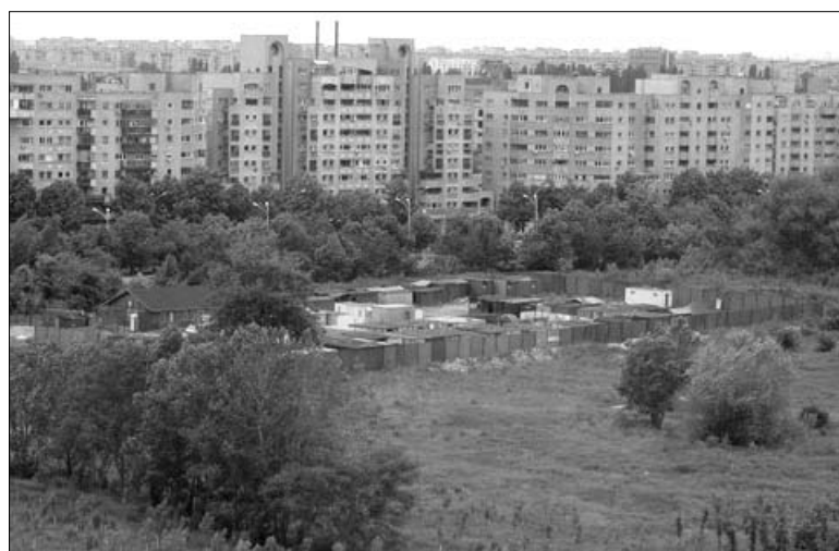
Romská osada obklopená sídlištem ve velmi dezolátním stavu

Po roce 1965 začala být v Rumunsku uplatňována pracovní povinnost v rámci politiky stoprocentní zaměstnanosti. Dekret č. 153 z roku 1970 trestal „sociální parazitismus, anarchismus a deviaci od socialistického způsobu života“ vězením. Ačkoliv dekret nijak jmenovitě nespécifikoval Romy, bylo jasné, kdo nejvíce nevyhovuje vyžadovaným normám. Jediným oficiálním dokumentem týkajícím se