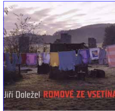
Jiří Doležel ROMOVÉ ZE VSETÍNA

Publikace Romové ze Vsetína přináší sérii snímků fotografa Jiřího Doležela, která mapuje osudy čtyř vel-