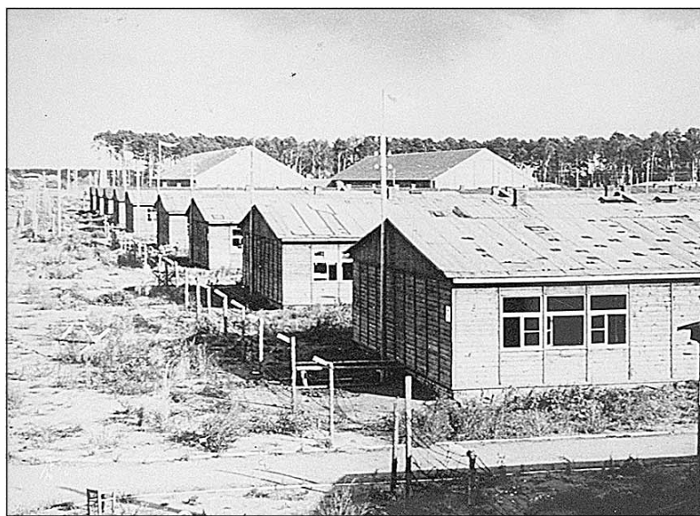
Ubikace koncentračního tábora Stutthof